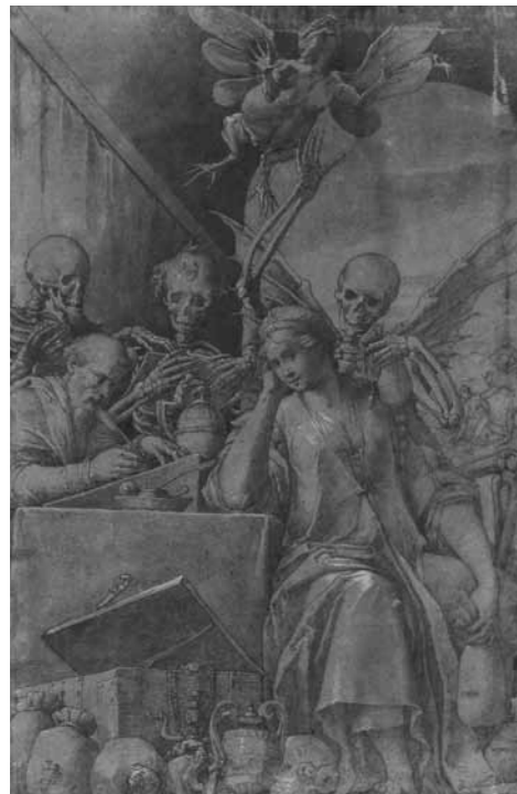
Fig. 1 - Jacopo Ligozzi, Allegoria dell'Avarizia , 1590. Washington, National Gallery of Art

Bibliografia: VOSS 1920, fig. 165; LONDRA 1982, n. 13; LONDRA 1985, n. 5; FEINBERG 1991, pp. 108-109, n. 21; L. Conigliello, in FIRENZE-CHICAGO-DETROIT 2002, n. 177, pp. 312-313, fig. 177; L. Conigliello, in PARIGI 2005, nn. 6-7 e 8-9, pp. 68-69